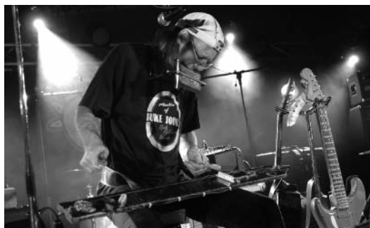
One man band