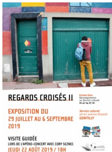
Exposition Regards croisés II