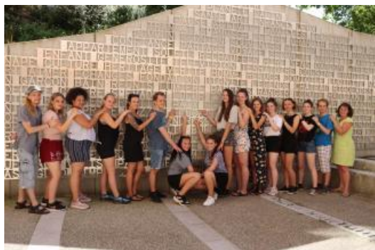
Les jeunes sur la parvis de la Maison des familles

Du mercredi 3 au dimanche 7 juillet a été reçu à Gentilly un groupe de 13 jeunes. Les villes représentées étaient Freiberg avec 3 jeunes membres du Parlement des enfants et de la jeunesse, Darmstadt, Příbram (République Tchèque) et Gentilly. Le thème de la rencontre était « Agir ensemble pour un avenir commun à la jeunesse de l'Europe ».