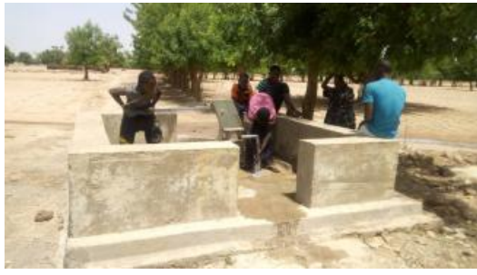
Une des deux pompes à eau réhabilitées à Hamadila

2017-2019 : En 2017, les jeunes européens ont choisi de s'engager ensemble pour un projet de solidarité internationale : financer une pompe à eau au Mali à Duguwolowila dans le cadre de la coopération entre Gentilly et Duguwolowila. Ils ont ainsi récolté suffisamment d'argent pour réhabiliter deux pompes à eau du village d'Hamadila. Ce village de 600 habitants ne disposait que d'une seule pompe à eau pour tous ses habitants. La réhabilitation a eut lieu en avril 2019 et les deux pompes sont aujourd'hui fonctionnelles. Les jeunes de Gentilly ont récolté des fonds grâce à la vente de gâteaux sur le marché du centre ville mais aussi en sollicitant les acteurs gentilléens. L'ACTIG a notamment contribué à ce projet.