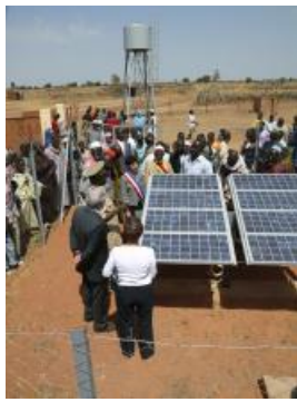
Visite d'une délégation gentilléenne à Kolobo

2005 : inauguration d'un centre de santé communautaire (CSCoM) à Kolobo (village de Duguwolowila), qui mène une politique de santé et de veille sanitaire pour les habitants de 9 villages. Le centre a été électrifié en 2007, grâce à des panneaux photovoltaïques offerts par Freiberg. Un système d'adduction d'eau potable a été mis en place en 2008.