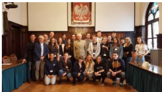
Rencontre de jeunes européens à Wałbrzych (Pologne) en 2017

Depuis, les activités de toutes sortes se sont beaucoup développées : échanges scolaires, sportifs, artistiques et culturels, favorisant les rencontres entre les citoyens et les associations des deux villes.