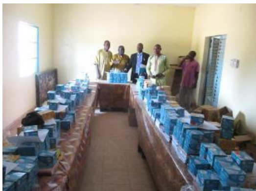
Remise des fournitures aux enseignants en 2017

2015-2016 : début du projet d'amélioration de l'accès à l'eau, de l'assainissement et de l'hygiène à Duguwolowila (détaillé ci-contre)