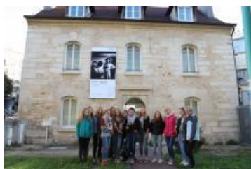
Visite de la Maison de la photographie R. Doisneau - septembre 2018

Des échanges scolaires ont lieu depuis de nombreuses années entre le collège Rosa Parks de Gentilly et le lycée Geschwister-Scholl à Freiberg. Depuis 2018, les jeunes gentilléens peuvent se rendre à Freiberg lors d'un séjour de vacances linguistique au printemps. Ce séjour est ouvert à tous les gentilléens de 13 à 16 ans. Des bases en anglais sont requises mais il n'est pas nécessaire d'être germanophone.