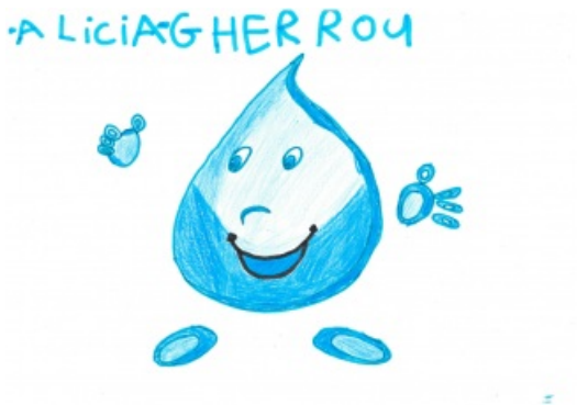
Catégorie Grande section - CP