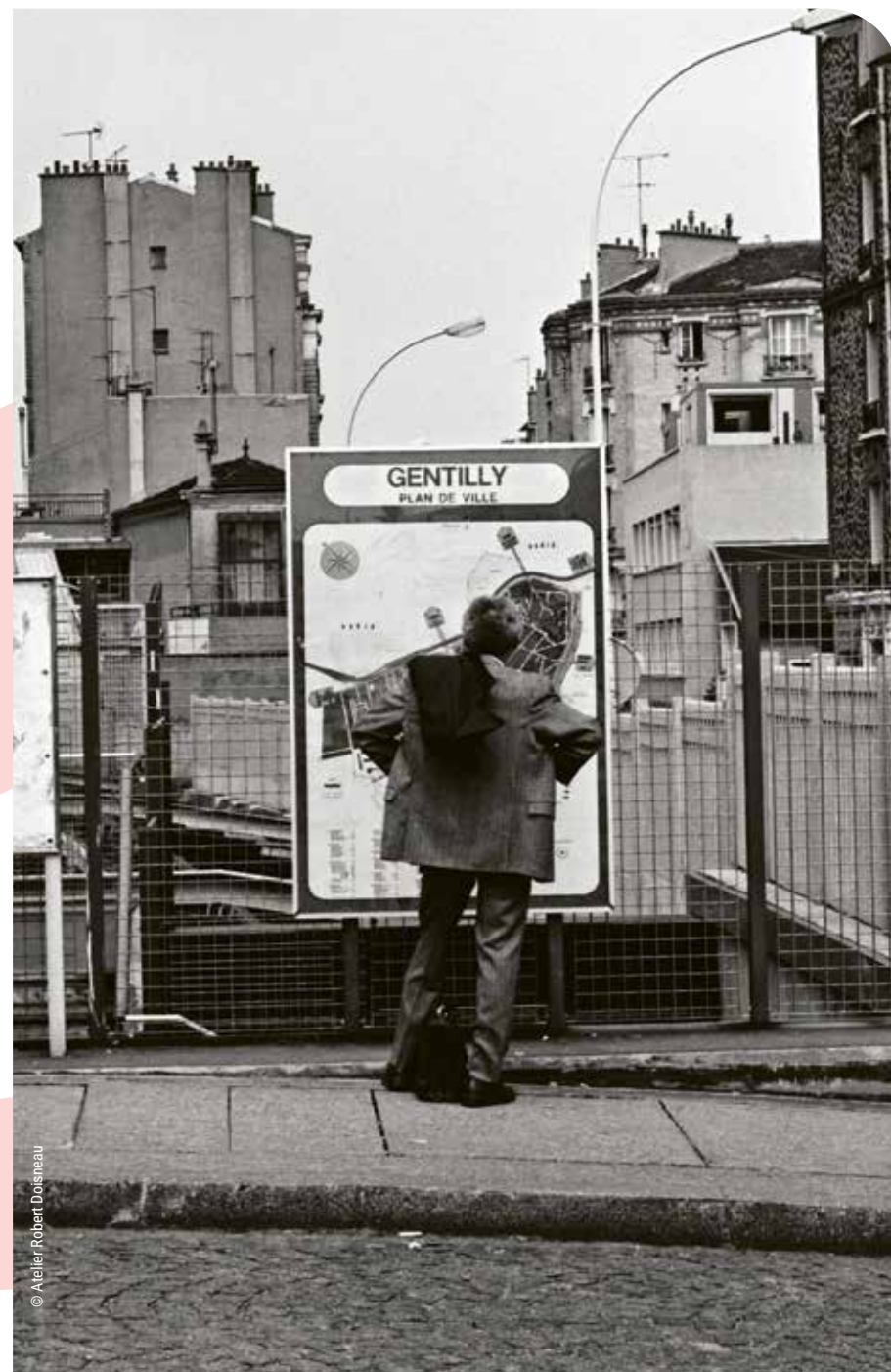
Station [RER B], Gentilly, 28 avril 1990.

Exposition réalisée en collaboration avec l'atelier Robert Doisneau