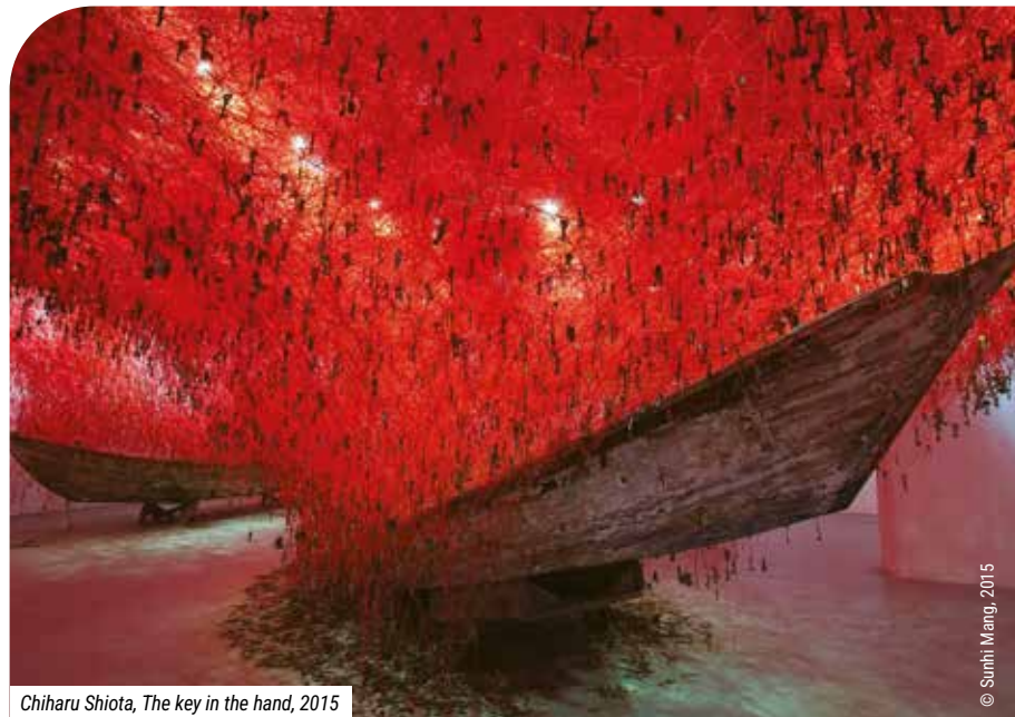
Chiharu Shiota, The key in the hand , 2015