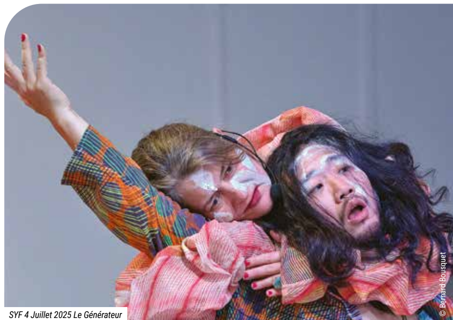
SYF 4 Juillet 2025 Le Générateur