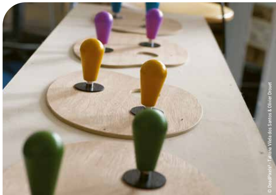
© DeadPixels - Tatiana Vilela dos Santos &amp; Olivier Drouet