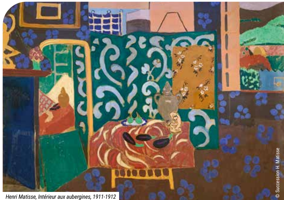
Henri Matisse, Intérieur aux aubergines, 1911-1912