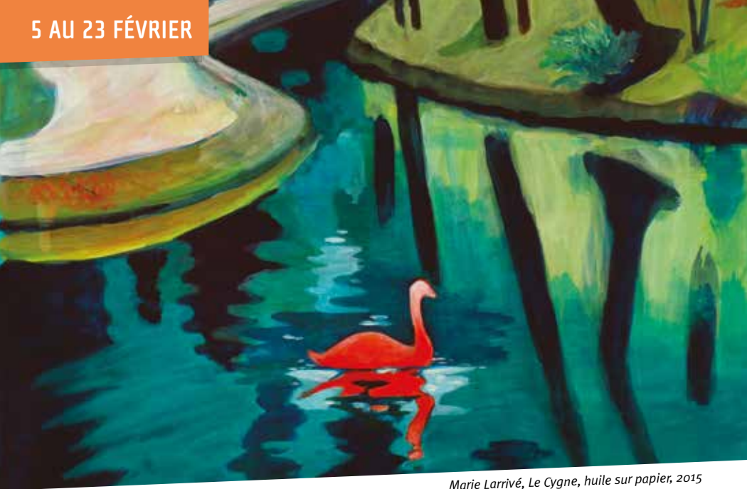
Marie Larrivé, Le Cygne , huile sur papier, 2015