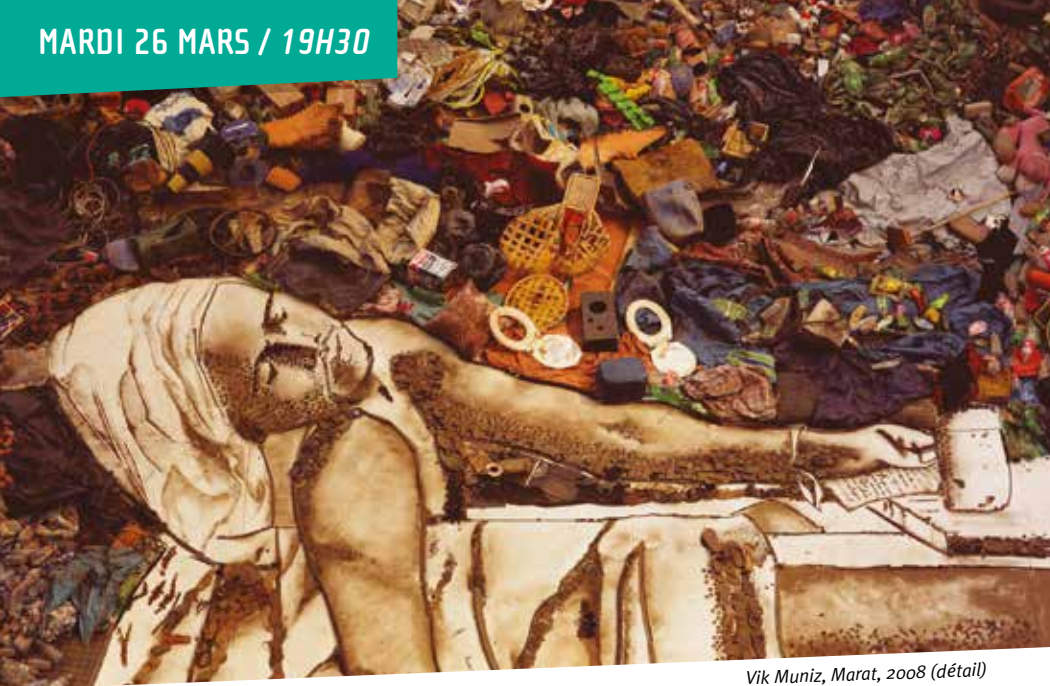
Vik Muniz, Marat, 2008 (détail)