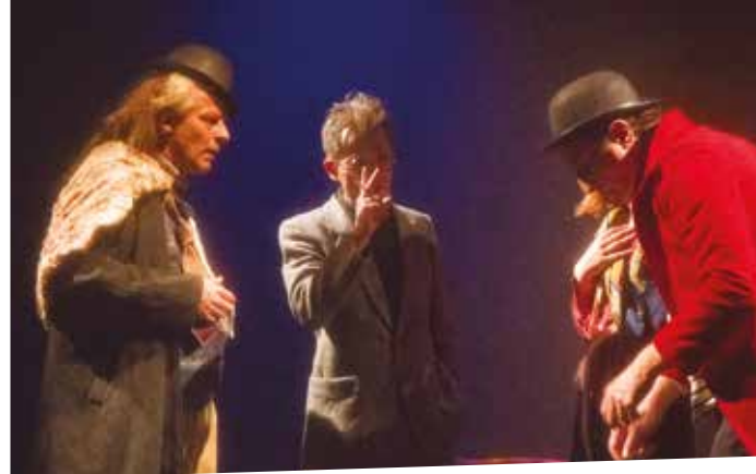
Naissance d'un chef d'oeuvre