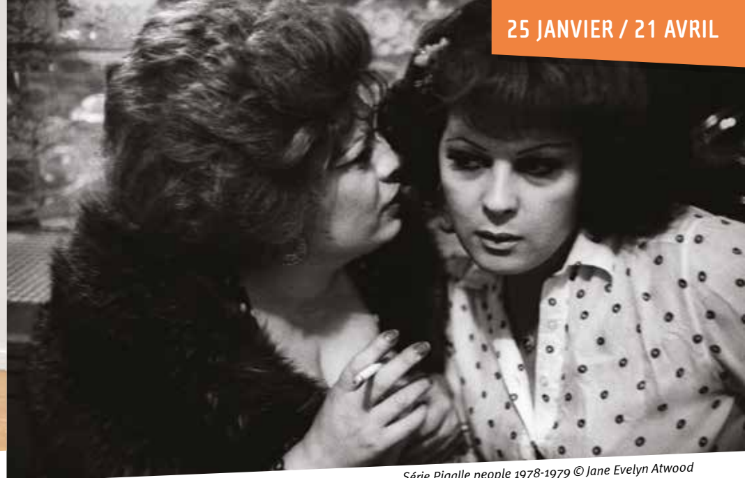
Série Pigalle people 1978-1979