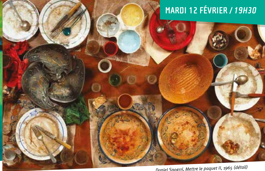
Daniel Spoerri, Mettre le paquet II , 1965 (détail)