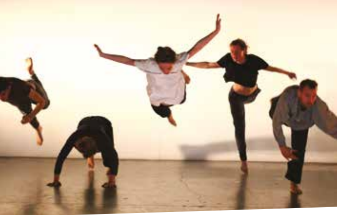
Nuit Blanche Entre chien et loup de Biño Sauitzvy Le Générateur 2018