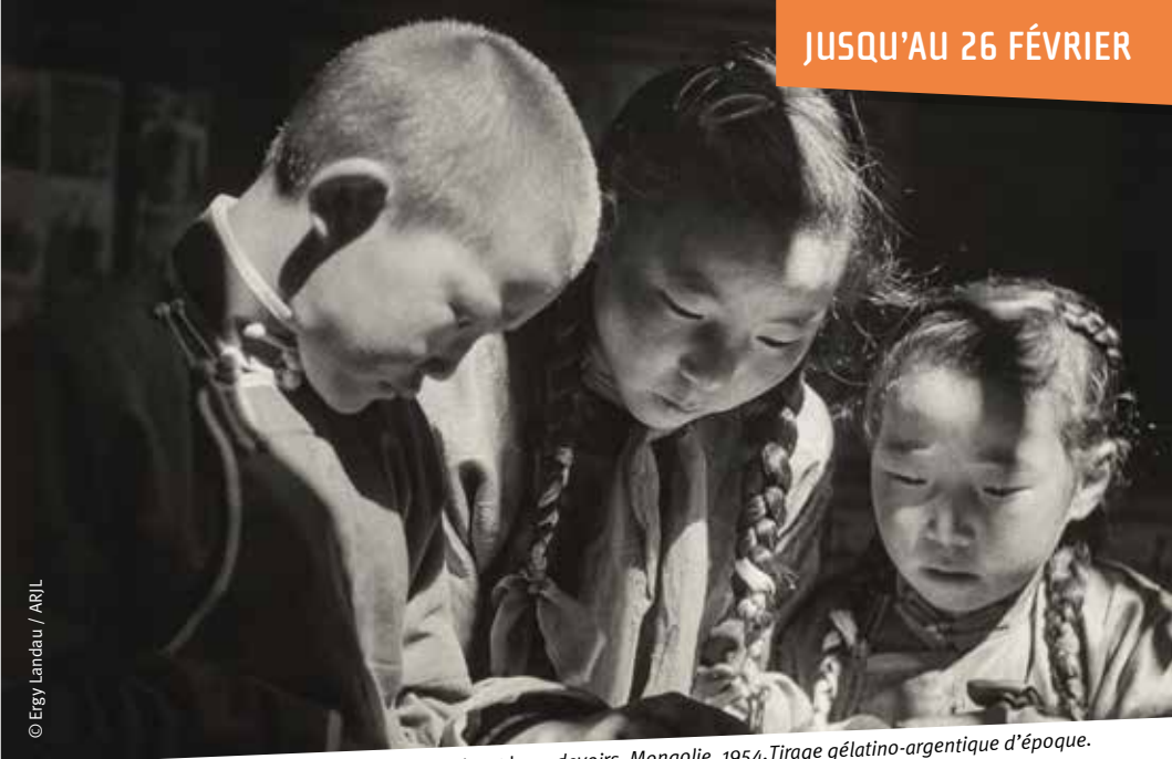
Enfants faisant leurs devoirs, Mongolie, 1954. Tirage gélatino-argentique d'époque.