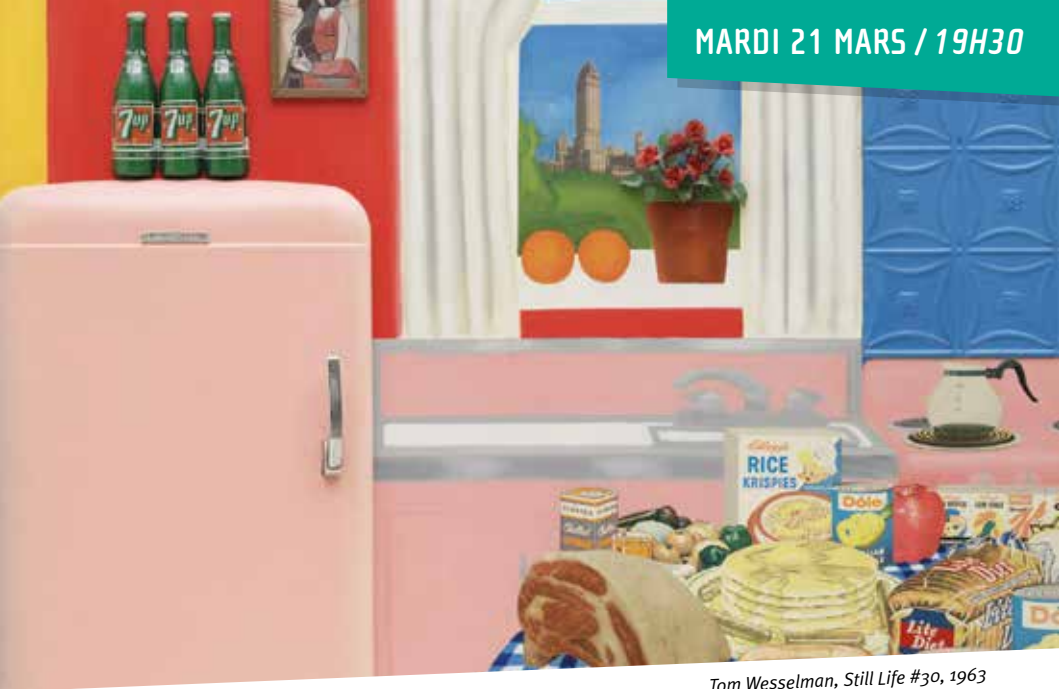
Tom Wesselman, Still Life #30, 1963