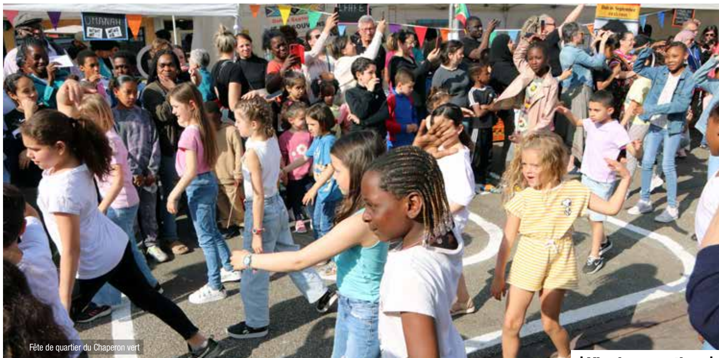
Fête de quartier du Chaperon vert