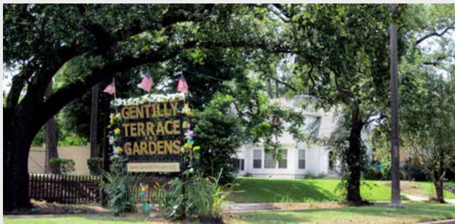
▲ Panneau d'entrée du quartier Gentilly Terrace à la Nouvelle Orléans, aux États-Unis.

État des communes à la fin du XIX e siècle : Gentilly, Département de la Seine, 1906 Wikipedia – Gentilly ; Gentilly (Val-de-Marne) ; Gentilly (Bécancour) ; Haut-du-Lièvre ; Histoire de Gentilly ; Gentilly (Minnesota) ; Gentilly, New Orleans Ville de Bécancour Margaret Maxwell – Gentilly Mapcarta