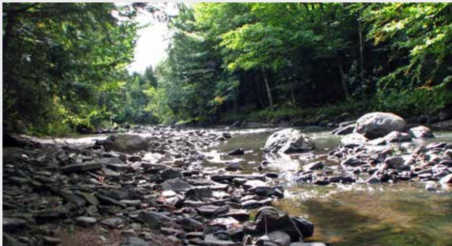
▲ Au Québec, une rivière porte le nom de Gentilly.

Bien que Gentilly soit initialement située en Île-de-France, il est possible de retrouver