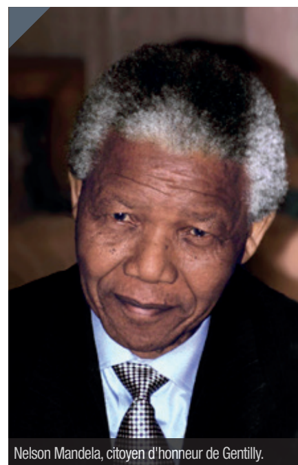
Nelson Mandela, citoyen d'honneur de Gentilly.