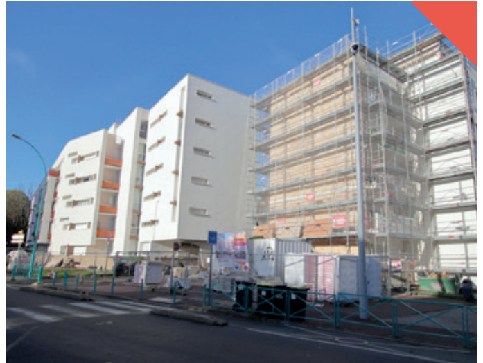
Résidence de la Chamoiserie en cours de réhabilitation.

“ Continuer à assurer des services publics utiles à toutes et à tous. ”