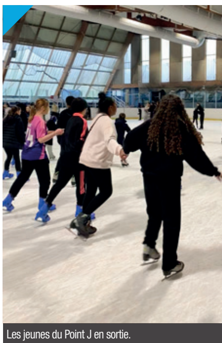
Les jeunes du Point J en sortie.