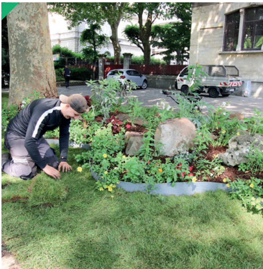
Plantation par le Service espace vert d'un massif de fleurs.